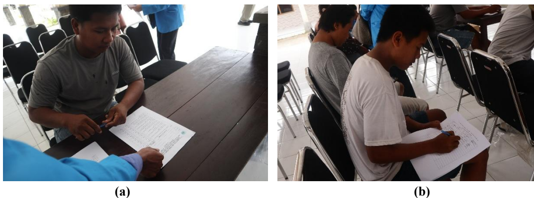
Gambar 3. Gambar (a) dan (b) Pelaksanaan kegiatan pre-test dan post-test peserta PkM

Materi awal diberikan dalam bentuk penyuluhan terkait prinsip dan keunggulan budidaya vertikultur sebagai solusi keterbatasan lahan. Sistem vertikultur dikenal efektif memanfaatkan ruang sempit karena penanaman dilakukan secara vertikal, sehingga meningkatkan produktivitas per satuan luas (Mangiring et al. , 2025). Teori ini sejalan dengan temuan FAO (2022) yang menyatakan bahwa sistem budidaya vertikultur mampu meningkatkan efisiensi ruang hingga 3–5 kali lipat dibandingkan tanam konvensional. Pemanfaatan lahan pekarangan secara intensif berperan dalam meningkatkan ketahanan pangan serta keragaman diet rumah tangga (Rammohan et al. , 2019; Blakstad et al. , 2021; Schreinemachers et al. , 2025).