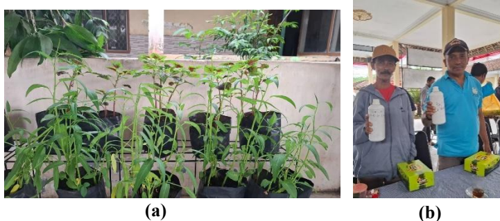
Gambar 5. (a) Penampakan tanaman sayuran setelah satu kali panen dan (b) pembagian POC kepada petani

Kenaikan ini memperlihatkan bahwa model pelatihan yang menggabungkan metode ceramah, demonstrasi, dan praktik lapangan sangat efektif dalam meningkatkan keterampilan masyarakat. Pola pembelajaran berbasis pengalaman ( experiential learning ) memberikan ruang bagi masyarakat untuk mencoba, bertanya, dan memperbaiki kesalahan secara langsung.