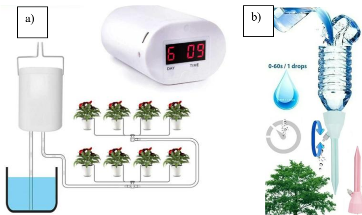
Gambar 2. Rancangan instalasi a) Sistem irigasi tetes otomatis ( drip irrigation ) dan b) Irigasi sederhana