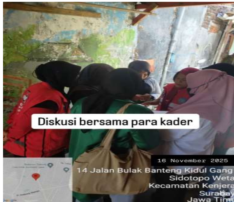
Gambar 3. Diskusi Awal bersama Kader Kesehatan dan Tim Pendamping

menyusun strategi pendampingan pencegahan stunting yang sesuai dengan kebutuhan dan karakteristik masyarakat setempat. Yang mana kegiatan diawali dengan sesi pembukaan yang berisi pengenalan tim pelaksana serta penyampaian tujuan dan kepentingan program pencegahan stunting kepada peserta. Penyampaian materi awal ini bertujuan membentuk pemahaman dasar sebelum memasuki sesi edukasi inti. Edukasi berbasis penyuluhan terbukti efektif dalam meningkatkan kesadaran masyarakat terhadap isu stunting apabila dilakukan secara komunikatif dan informatif.