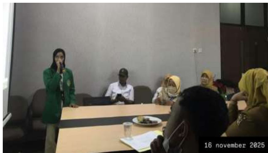
Gambar 5. Penyampaian Pemaparan Hasil Informasi Gizi

Gambar 4 memperlihatkan proses pendampingan secara langsung kepada orang tua balita yang dilakukan oleh tim pengabdian bersama kader kesehatan. Pada kegiatan ini, orang tua diberikan penjelasan mengenai pentingnya pemenuhan gizi anak, khususnya pada masa 1.000 Hari Pertama Kehidupan, serta dampak jangka panjang stunting terhadap tumbuh kembang anak. Edukasi dilakukan secara komunikatif dengan pendekatan personal agar informasi dapat dipahami dengan baik. Interaksi dua arah ini memungkinkan orang tua menyampaikan pertanyaan dan permasalahan yang mereka hadapi dalam pemenuhan gizi anak sehari-hari. Sesi diskusi dilakukan untuk menggali pengalaman, kendala, serta persepsi orang tua terkait pemenuhan gizi anak. Kegiatan ini memungkinkan terjadinya pertukaran informasi antara peserta dan fasilitator sehingga solusi yang diberikan lebih sesuai dengan kondisi lokal masyarakat. Metode partisipatif seperti diskusi kelompok dinilai efektif dalam membangun kesadaran kolektif serta mendorong perubahan perilaku kesehatan keluarga (Irwanto, 2024). Interaksi aktif peserta menunjukkan adanya peningkatan ketertarikan dan keterlibatan dalam isu pencegahan stunting.