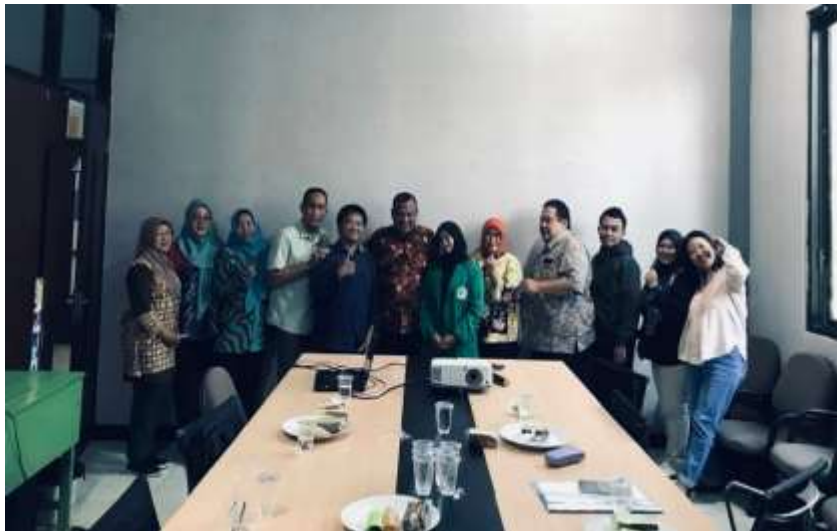
Gambar 6. Dokumentasi Bersama sebagai Bentuk Komitmen Bersama

Pada gambar 5 menunjukkan kegiatan pembacaan hasil pengabdian masyarakat yang merupakan bagian dari tahapan pemaparan data balita di Kecamatan Kenjeran yang teridentifikasi memiliki potensi risiko stunting. Pada sesi ini, tim pelaksana menyampaikan hasil pengumpulan dan pengolahan data yang diperoleh dari pendampingan lapangan, wawancara dengan orang tua, serta koordinasi dengan kader kesehatan setempat. Data yang dipaparkan mencakup kondisi pertumbuhan balita. Penyampaian hasil dilakukan secara terbuka dan komunikatif kepada para pemangku kepentingan, termasuk kader dan perwakilan masyarakat, sebagai bentuk transparansi sekaligus upaya meningkatkan pemahaman bersama mengenai urgensi pencegahan stunting. Pendampingan personal dalam program gizi masyarakat terbukti dapat meningkatkan kepatuhan orang tua dalam menerapkan pola asuh dan pola makan sehat (Sarwoyo et al. , 2024). Dengan adanya konsultasi langsung, peserta lebih terbuka dalam menyampaikan permasalahan yang dihadapi. Melalui kegiatan ini, masyarakat diharapkan mampu mengenali kondisi balita yang berisiko sejak dini serta memahami pentingnya peran orang tua dan lingkungan dalam mendukung pemenuhan gizi dan pemantauan tumbuh kembang anak secara berkelanjutan.