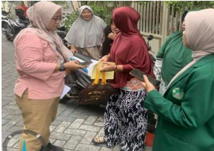
Gambar 4. Pendampingan dan Edukasi Langsung kepada Orang Tua Balita

Gambar 4 memperlihatkan proses pendampingan secara langsung kepada orang tua balita yang dilakukan oleh tim pengabdian bersama kader kesehatan. Pada kegiatan ini, orang tua diberikan penjelasan mengenai pentingnya pemenuhan gizi anak, khususnya pada masa 1.000 Hari Pertama Kehidupan, serta dampak jangka panjang stunting terhadap tumbuh kembang anak. Edukasi dilakukan secara komunikatif dengan pendekatan personal agar informasi dapat dipahami dengan baik. Interaksi dua arah ini memungkinkan orang tua menyampaikan pertanyaan dan permasalahan yang mereka hadapi dalam pemenuhan gizi anak sehari-hari. Sesi diskusi dilakukan untuk menggali pengalaman, kendala, serta persepsi orang tua terkait pemenuhan gizi anak. Kegiatan ini memungkinkan terjadinya pertukaran informasi antara peserta dan fasilitator sehingga solusi yang diberikan lebih sesuai dengan kondisi lokal masyarakat. Metode partisipatif seperti diskusi kelompok dinilai efektif dalam membangun kesadaran kolektif serta mendorong perubahan perilaku kesehatan keluarga (Irwanto, 2024). Interaksi aktif peserta menunjukkan adanya peningkatan ketertarikan dan keterlibatan dalam isu pencegahan stunting.