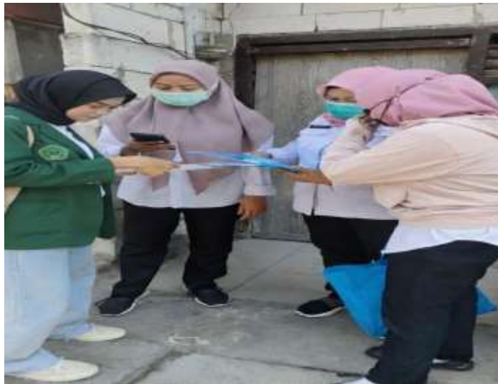
Gambar 2. Edukasi Kelompok dan Koordinasi dengan Pemangku Kepentingan

Pada gambar 2 menunjukkan kegiatan edukasi kelompok yang dilaksanakan dalam forum pertemuan bersama perangkat kelurahan, kader kesehatan, dan perwakilan masyarakat. Dalam kegiatan ini, tim pengabdian menyampaikan materi mengenai pencegahan stunting, peran orang tua, serta pentingnya kolaborasi lintas sektor dalam menurunkan angka stunting di Kecamatan Kenjeran. Diskusi yang berlangsung menunjukkan adanya dukungan dari pemangku kepentingan lokal terhadap upaya pendampingan yang dilakukan, sekaligus memperkuat sinergi antara masyarakat dan institusi terkait (Khoirinisa et al. , 2025). Kegiatan ini menjadi langkah awal dalam